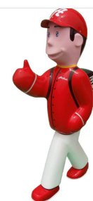
FIGURINE DE SIGNALISATION 3D: ARTHUR DYNAMIQUE CASQUETTE VISIERE AVANT

« Un impact visuel très fort (de jour comme de nuit) pour la sécurité des écoles incitant au réflexe : "Je ralentis parce qu'il y a des enfants..." ; . Renforcement de la sécurité des périmètres scolaires ainsi que les cheminements piétonniers des enfants ; . Grâce à leur grande taille de plus de 1,60 m, et à leur décoration aux couleurs vives, les personnages sont visibles de loin et deviennent vite les "copains" de nos enfants »